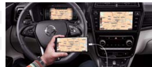
Dual Navi/ Android Auto/ Apple CarPlay