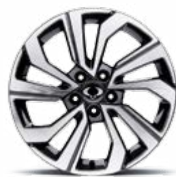
18" felgi aluminiowe "diamentowe" (215/50)