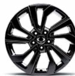
18" felgi aluminiowe czarne "diamentowe" (215/50)