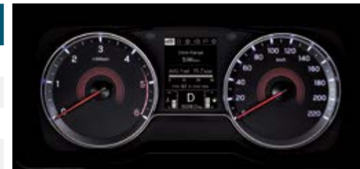
3,5" LCD – wyświetlacz komputera pokładowego