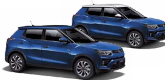
Dandy Blue (metal.)