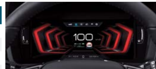
10,25" wyświetlacz LCD HD