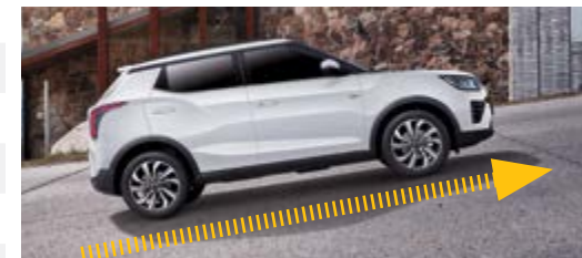
HSA – asystent wjazdu na wzniesienia