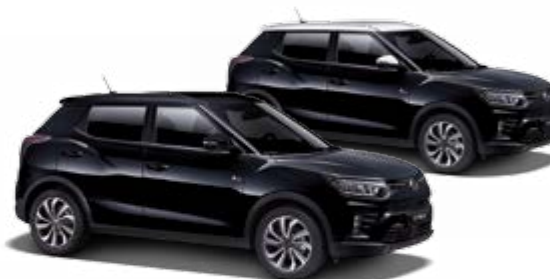
Space Black (metal.)