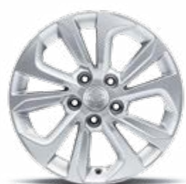
16" felgi aluminiowe (205/65)