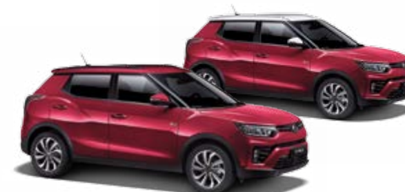
Cherry Red (metal.)